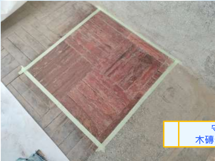
守C棟 木磚修復試做