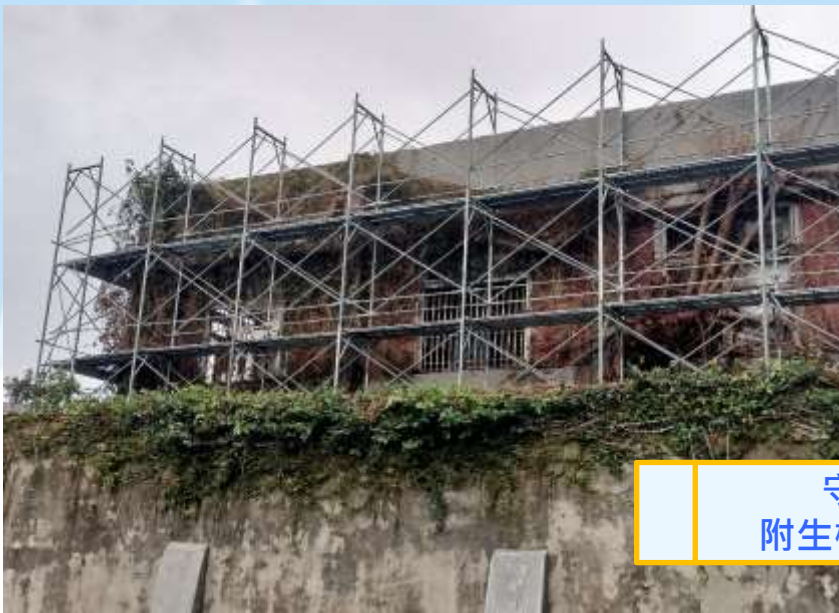
守B棟 附生樹木移除